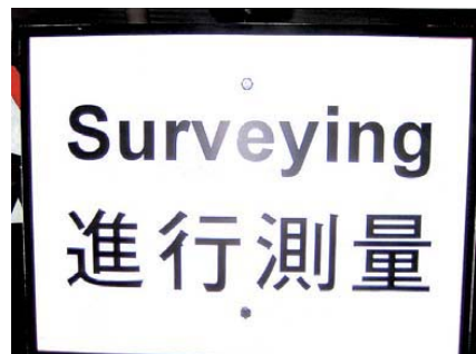
Abb. 5: Schild an der PolyU, Hongkong

Um den Einsatz von GPS für lokale Vermessung zu ermöglichen, wurde mit der „1991 GPS Network“-Kampagne eine Überführung der Koordinaten vom System