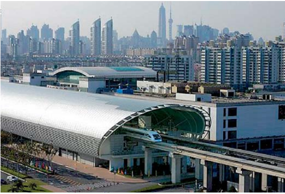
Abb. 3: Transrapidstation Longyuan Road Station, Shanghai

benachbarter Punkte. Setzungen an flach gegründeten Pfeilern machten teilweise Neuvermessungen erforderlich.