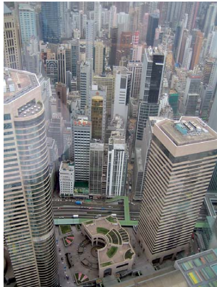
Abb. 4: Stadtansicht Hongkong

Die „Geodetic Survey Section“ des SMO ist mit der Vorhaltung des geodätischen Grundlagentznetzes betraut. Die Historie der Referenzsysteme spiegelt die geschichtliche Entwicklung Hongkongs wider. Zwischen 1845 und 1904 wurden einzelne Triangulationsmessungen durch Leutnant Collins (1845), Tate (1899/1900) und Newland (1903/04) durchgeführt. 1928/29 erstellte die Royal Air Force eine militärische Karte im Maßstab 1:20000, basierend auf Luftbildern aus den Jahren 1924/25, her. Die nötigen Passpunkte auf dem Land wurden durch die Zweite Ko-