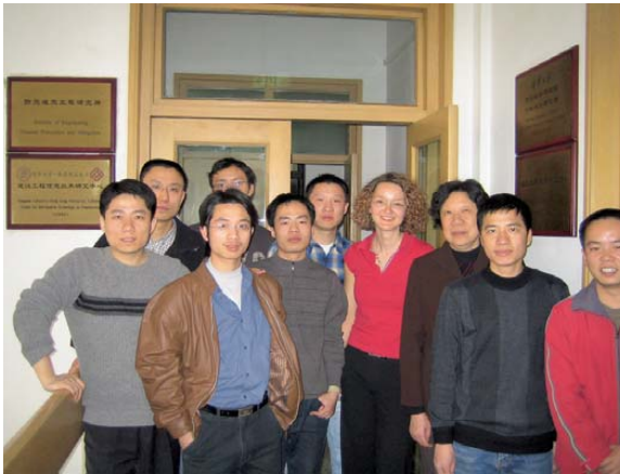
Abb. 1: Besuch der Tsinghua-Universität, Beijing

Die Genauigkeit des Katasters beläuft sich auf ca. \pm 5 cm. Die Inhalte dieser Karten sind Grundlage eines Geobasisdateninformationssystemsystems. Probleme treten auf, weil es für die Umsetzung aufgrund der riesigen Fläche Chinas an Geld mangelt, die notwendige Technologie nicht immer ausreichend und teilweise nicht genügend qualifiziertes Personal vorhanden ist. Um