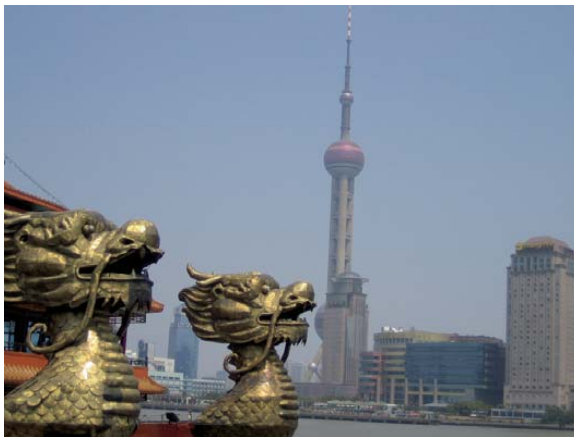
Abb. 2: Blick vom Bund auf Pudong (mit Oriental Pearl TV Tower im Hintergrund), Shanghai

Die Hauptaufgabe des „Shanghai Municipal Institute of Surveying & Mapping“