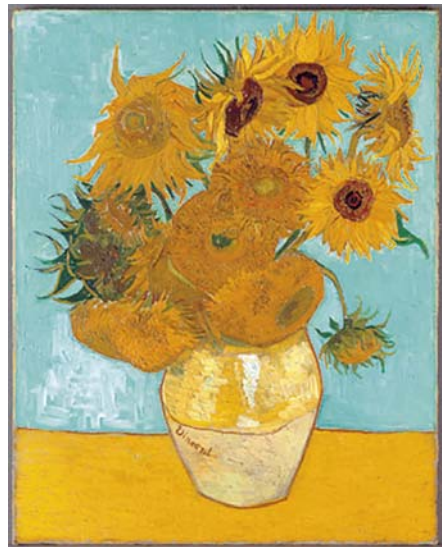
Abb. 3: Vincent van Gogh: Sonnenblumen, 1888, Neue Pinakothek München

Die aufgezeigten Merkmale einer individuellen Gestaltung in Farbe, Kartenzeichen und Generalisierung machen die Karte zu einem schutzfähigen Werk der Lite-