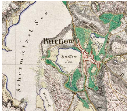
Abb. 1: Messtischblatt 1:25 000, Blatt 3450 Müncheberg, Preußische Landesaufnahme 1840 (Uraufnahme), Ausschnitt Buckow - Staatsbibliothek zu Berlin - Preußischer Kulturbesitz

Müncheberg von 1840 gelten (Abb. 1), das wir gerne betrachten und uns an den einzelnen von Hand gezeichneten Vegetationszeichen, den Bergschraffen oder den individuellen Schriften erfreuen. Erst in zweiter Linie werden wir eine solche