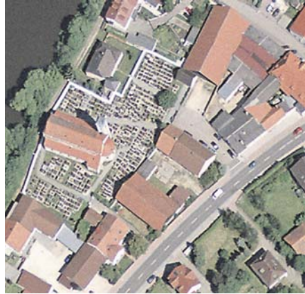
Abb. 5: Orthophoto Zeitlarn bei Regensburg, 2004

beste Siedlungsdarstellung, mit Flächen oder mit Gebäudesignaturen. Über diese Aufgabe, die Natur bestmöglich in der Karte abzubilden, sind ganze Lehrbücher geschrieben worden. Wir beschränken uns hier auf den Vergleich des Naturbildes (Abb. 5) mit dem Ergebnis der Kartenabbildung (Abb. 6), in der die Katasterkarte, ATKIS® und die TK25 übereinander dargestellt sind. Allein die Kombination