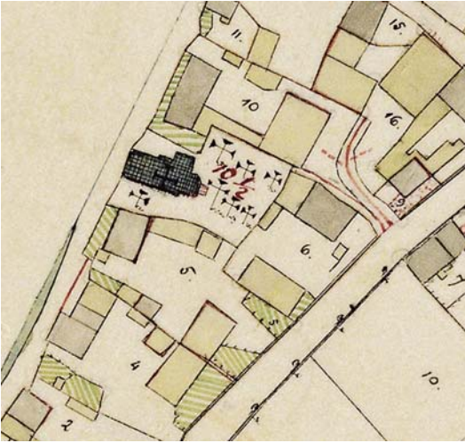
Abb. 4: Katasterkarte 1:2 500, Uraufnahme 1832, Zeitlarn bei Regensburg, LVG Bayern

Unterschied anschaulich. Die ständige Rechtsprechung seit Inkrafttreten des UrhG im Jahre 1965 hat den verschiedenen Kartentypen entsprechend ihrem jeweiligen Freiraum für die individuelle Gestaltung unterschiedlichen Schutzzumfang zugebilligt. Dieser ist bei Stadtplänen höher als bei topographischen Karten und dort wiederum höher als bei Katasterkarten. Letzteres trifft für heutige Katasterkarten sicherlich zu, während ihre Vorläufer (Abb. 4) deutliche Merkmale individueller Gestaltung aufweisen, wie z.B. die Darstellung der Hausgärten oder der Friedhofskreuze. Maßgebend für die Katasterkarte ist aber ihr Zweck als Grundbuchkarte mit Regelungscharakter bezüglich der Eigentums Grenzen. Dieser macht sie zum amtlichen Werk nach § 5 UrhG und schließt sie vom Schutz nach § 2 UrhG aus.