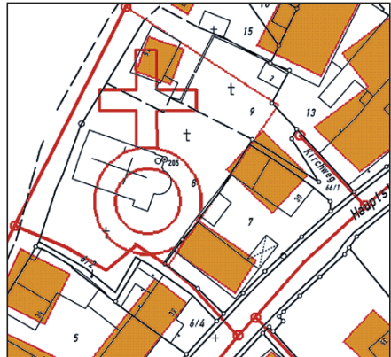
Abb. 6: Datenbankauszüge ALK und ATKIS®, Zeitlarn, LVG Bayern - Katasterkarte (schwarz) - ATKIS® (Straßenachsen und Friedhofsbegrenzung in rot) - TK25 (generalisierte Gebäude in orange, Kirchensignatur)