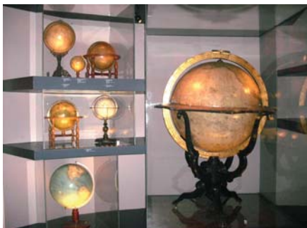
Abb. 3: Das Globenmuseum der Österreichischen Nationalbibliothek

Ein besonderer Höhepunkt war der Besuch des Globenmuseums der Österreichischen Nationalbibliothek. Zu besichtigen waren wertvolle Erd- und Himmelsgloben aus fünf Jahrhunderten und historische wissenschaftliche Elemente.