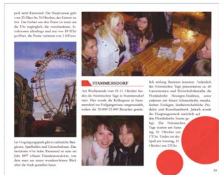
Abb. 5: Inhaltsseite des erstellten Reiseführers

ligt waren, insbesondere auch der LGB, die uns organisatorisch und finanziell unterstützt hat.