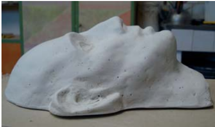
Abb. 2: Skulpturenkopf aus Gips

Mein Interesse galt im besonderen Maße der Kunst. Für mich ergab sich die Möglichkeit, an einer Staffelei zu arbeiten und aus Gips eine Skulptur herzustellen. Der Lehrer, ein studierter Kunsthistoriker, sprach ein wenig Englisch, sodass das Kommunizieren leichter fiel. Somit konnte er mir lehrreiche Tipps und Verbesserungsvorschläge erteilen.