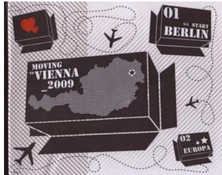
Abb. 4: Cover des erstellten Reiseführers

An dieser Stelle möchten wir recht herzlich Allen danken, die daran betei-