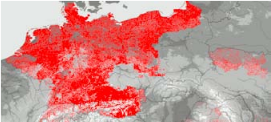
Abb. 1: Verfügbare Orte im Genealogischen Ortsverzeichnis

GOV ist eine Webanwendung, die von registrierten Benutzern gepflegt wird. Es soll hier über den Ausschnitt aus der Datenbank berichtet werden, der das heutige Land Brandenburg betrifft und der nach meiner Meinung das oben erwähnte Historische Ortslexikon inzwischen sehr gut ergänzt.