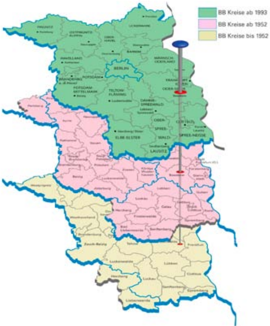
Abb. 3: Veränderung der Kreisstrukturen im Land Brandenburg. Für jede Gemeinde lässt sich in GOV die Zugehörigkeit zu den Landkreisen zeitlich ablesen.

Gemeinden waren, die Zuordnung zu den Landkreisen, die bis zum 25. Juli 1952 bestanden und die durch das „Gesetz über die weitere Demokratisierung des Aufbaus und der Arbeitsweise der staatlichen Organe im Lande Brandenburg“ [9] aufgelöst