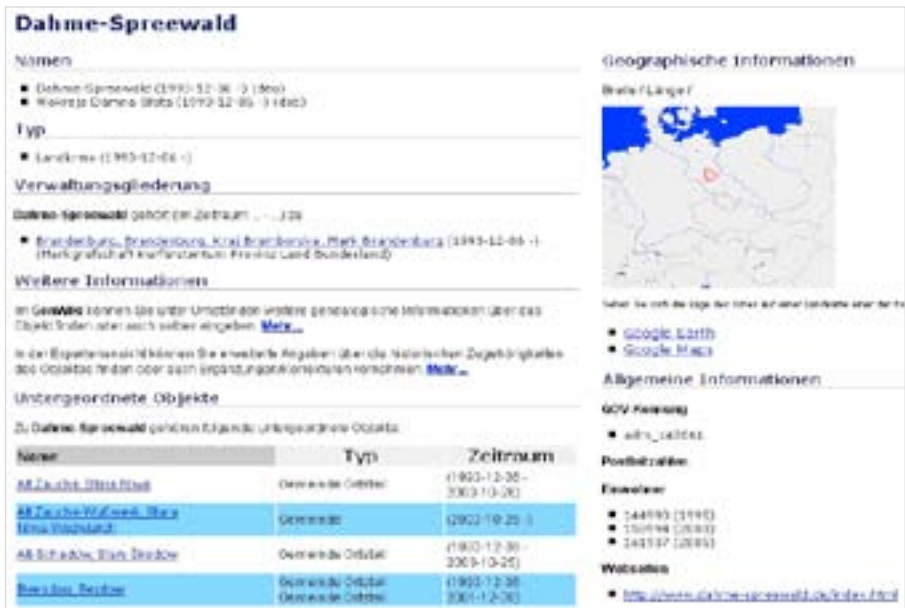
Abb. 2: Inhalt des GOV anhand der Benutzeransicht des Landkreises Dahme-Spreewald

In dieser Ansicht findet man den Namen des gesuchten Objektes, geographische und administrative Informationen, wie