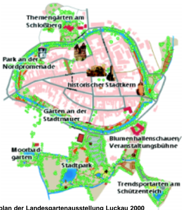
Abb. 2: Geländeplan der Landesgartenausstellung Luckau 2000