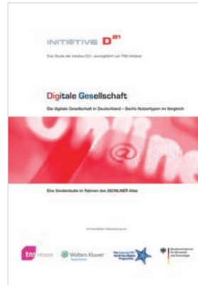
Abb. 1: Digitale Gesellschaft

Diese neue digitale Spaltung zieht sich nicht mehr ausschließlich entlang einer Ausstattungsgrenze, sondern definiert sich im Hinblick auf Kompetenz, Wissen, Nutzungsvielfalt und -intensität sowie der Einstellung gegenüber den digitalen Medien. Auf der Basis dieser Typologie lässt sich ein Bild der digitalen Gesellschaft in Deutschland wiedergeben. Sechs Gruppen konnten dabei identifiziert werden.