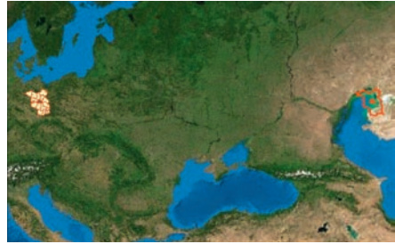
Abb. 3: Lagebezug ETRS89, Landesgrenze nicht projiziert, mit siebenstelligen Ostwerten