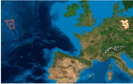
Abb. 2: Lagebezug ETRS89, Kreisgrenzen nicht projiziert, mit sechsstelligen Ostwerten